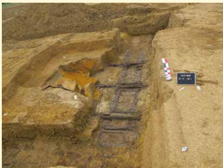
1. Vestige d'une tranchée de la batterie d'artillerie de Villevaudé (Seine-et-Marne) 1914 - 1916