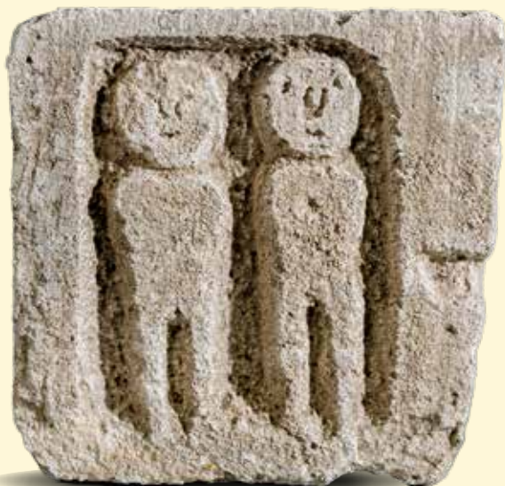
3. Stèle en calcaire Saint-Sauveur-lès-Bray (Seine-et-Marne), « Le Port aux Pierres » 50 – 280