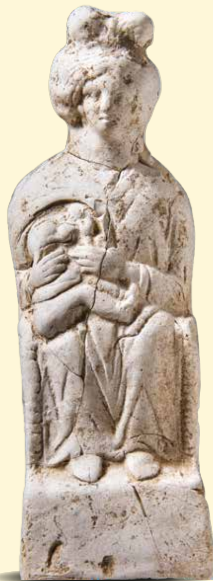
2. Figurine en terre cuite représentant une déesse-mère ou une nourrice Fin du II e – début du III e siècle Marolles-sur-Seine (Seine-et-Marne), « Le Chemin de Sens » ©Emmanuel Breteau